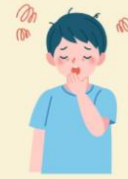
อ่อนเพลีย