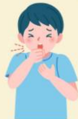
มีอาการไอ เจ็บคอ