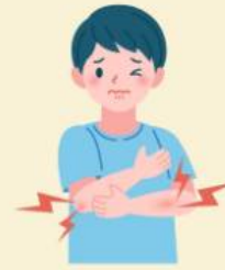
ปวดเมื่อยตามร่างกาย