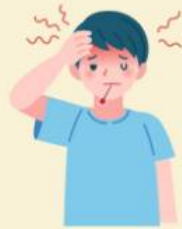
มีไข้สูง